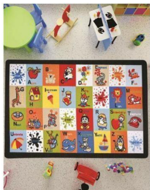
*Fotografie cu caracter informativ